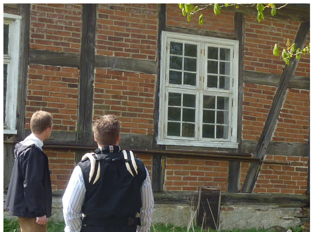
Ein originales Kreuzstockfenster aus der Erbauungszeit des Hauses Kaltenhof.

Außer ein paar Fundamentsteinen ist von der Kapelle nichts mehr übrig. 1892 hat es sie noch