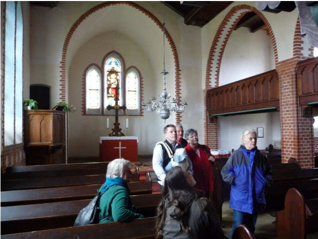
Kirche Glövzin, im Vorgängerbau befand sich die Familiengruft der Karstedts, die bis zum Bau der Kirche in Kaltenhof um 1711 genutzt wurde