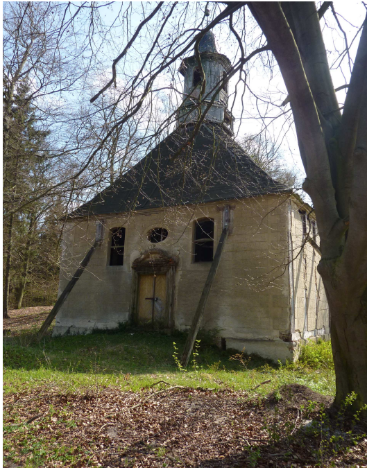
Vorderseite Gutskapelle Klein Linde