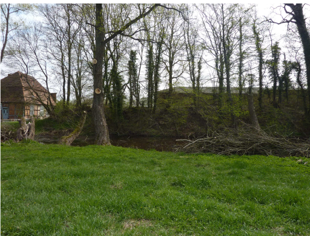
Blick vom ehemaligen Park auf den Rest des erhaltenen Walls, links der noch stehende Seitenflügel des Gutshauses Kaltenhof