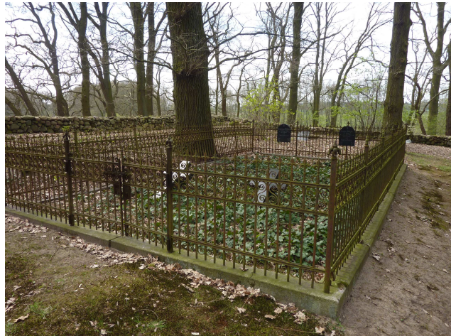
Friedhof des Vorwerks (zu Klein Linde) Gramzow mit dem Familiengrab der Familie Wöhlert