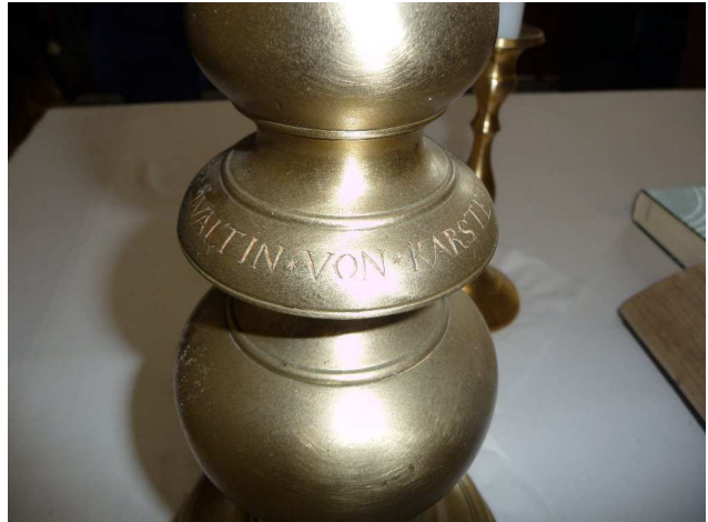
Detailaufnahme eines Leuchters, Messing, 1589