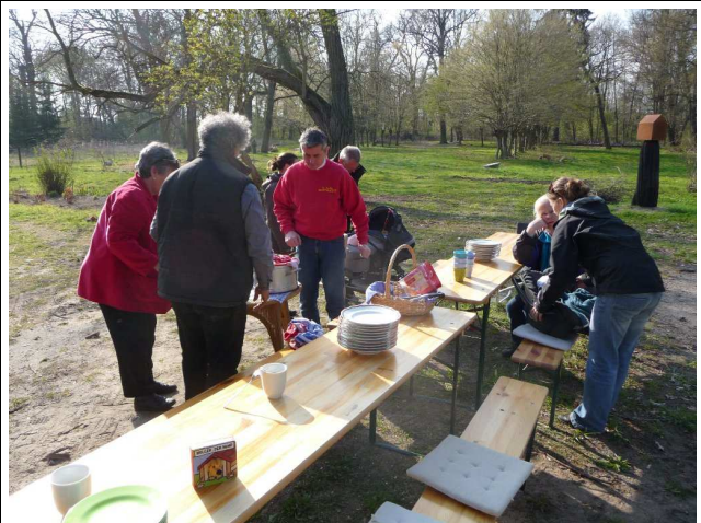
Vorbereitung der stärkenden Mahlzeit

Begeistert waren wir von den neuesten Veränderungen im Fretzdorfer Schloss. Die Eingangshalle wurde umgestaltet u. wirkt jetzt sehr großzügig.